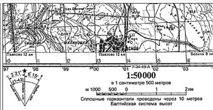
Фрагмент топографической карты с зарамочным оформлением

Крок — чертёж участка местности, отображающий её важнейшие элементы, выполненный при глазомерной съёмке. Крок перевала — рисунок перевала с соответствующими обозначениями на нём (длина участков, крутизна, характер склонов).